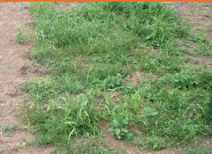
Vorsaat- und Vorauflaufbehandlung zur Bekämpfung der Altverunkrautung notwendig